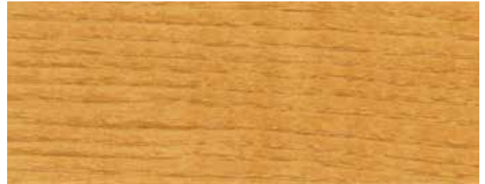
JOTUN 10073 ALTKIEFER