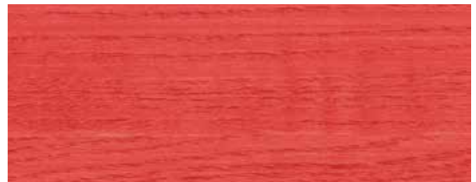
JOTUN 10041 SIGNALROT