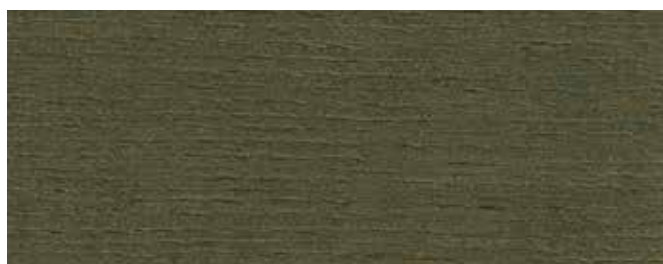
JOTUN 9708 SKOG