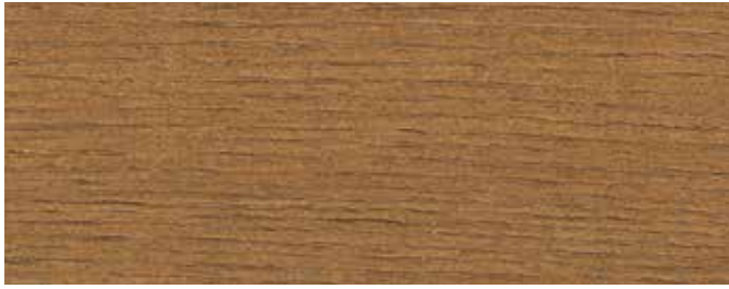
JOTUN 90000 TERRASSEBRUN