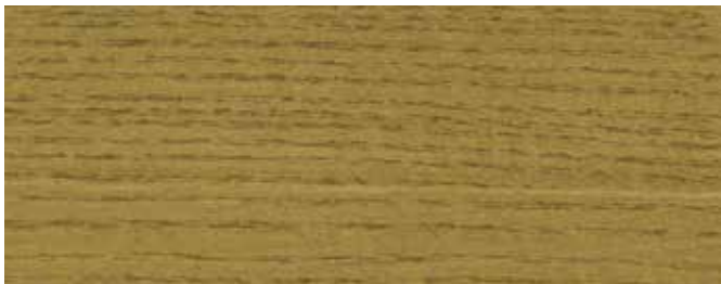
JOTUN 9701 TERRASSEGRØNN