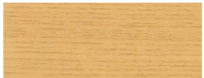
JOTUN 0631 NATURHOLZ