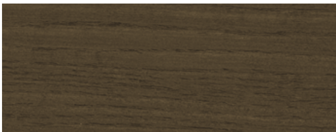
JOTUN 0683 SOTGRÅ