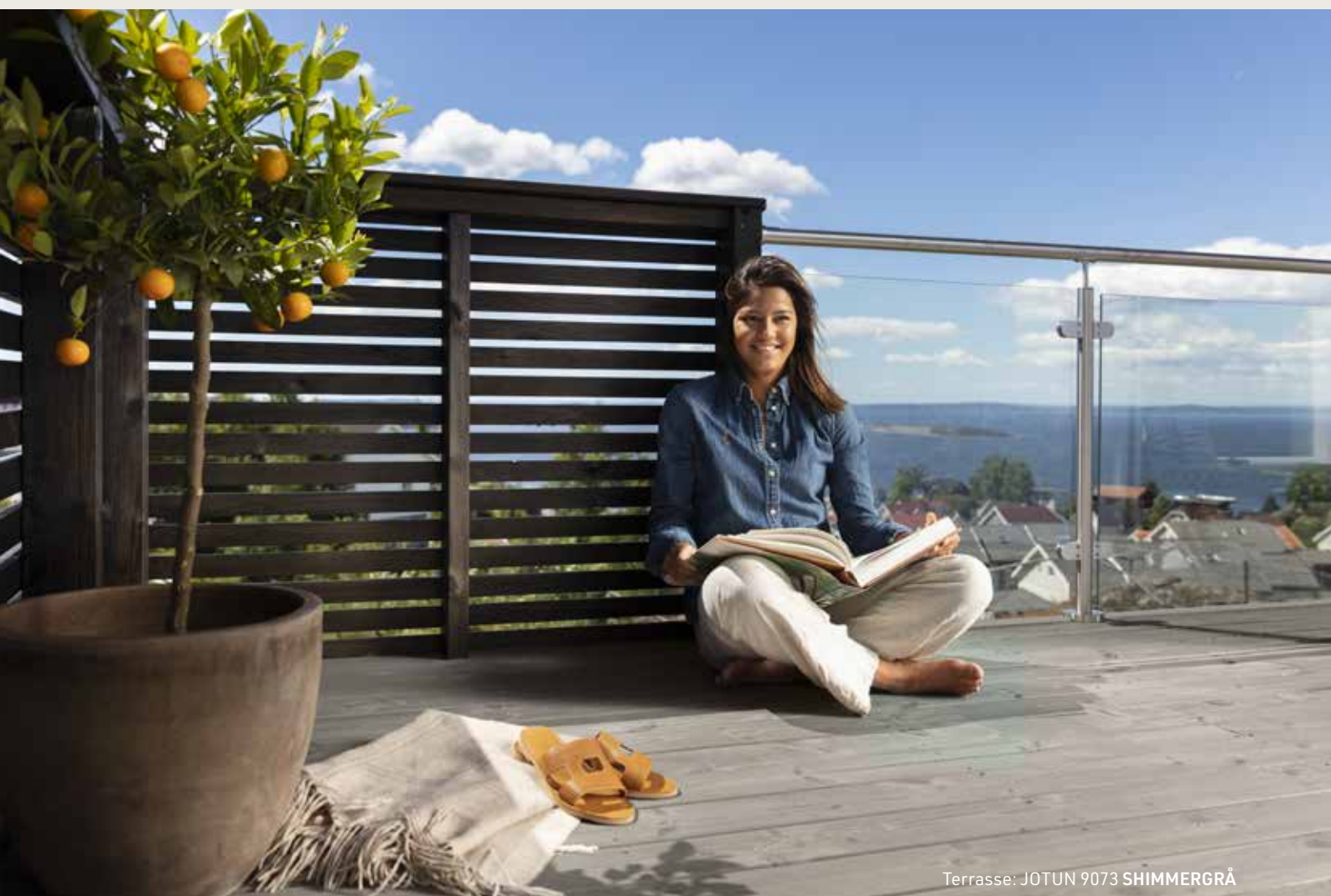
Terrasse: JOTUN 9073 SHIMMERGRÅ