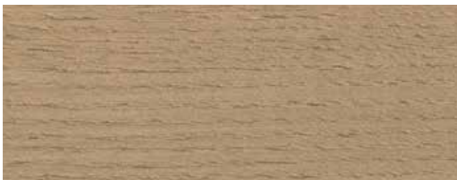
JOTUN 9074 NORDISK TRE