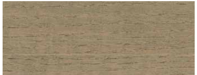
JOTUN 9706 SVABERG