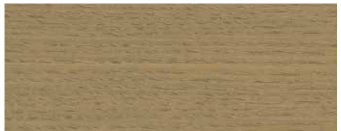
JOTUN 9707 GRÅSTEIN