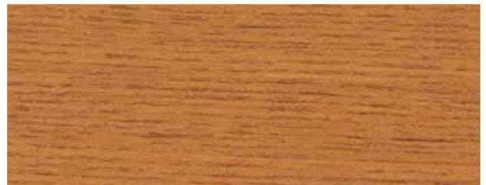
JOTUN 0623 BURMATEAK