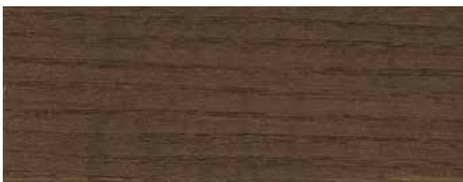
JOTUN 0675 PALISANDER