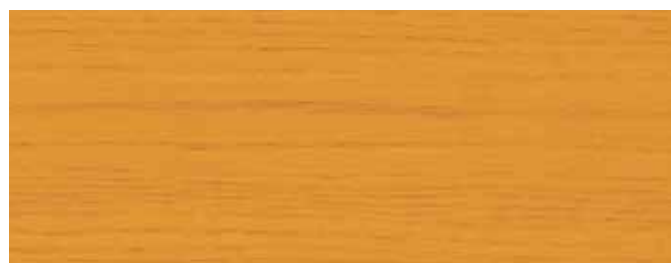
JOTUN 9053 HONNING