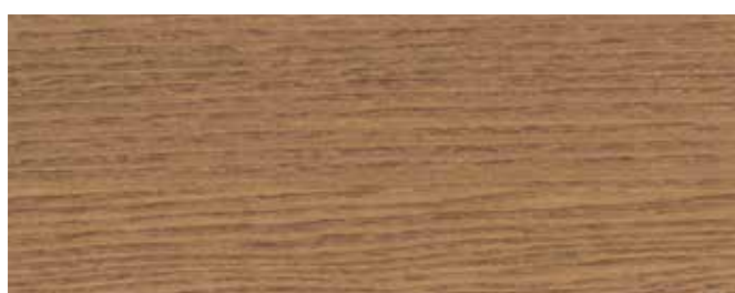
JOTUN 0676 TJÆREBRUN