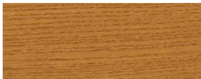
JOTUN 10009 EICHE DUNKEL