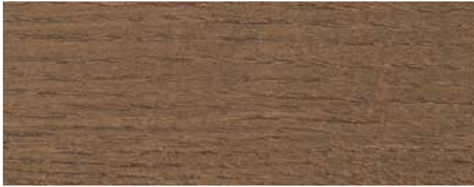
JOTUN 9052 EKSOTISK TRE