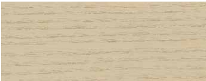
JOTUN 9072 NATURGRÅ