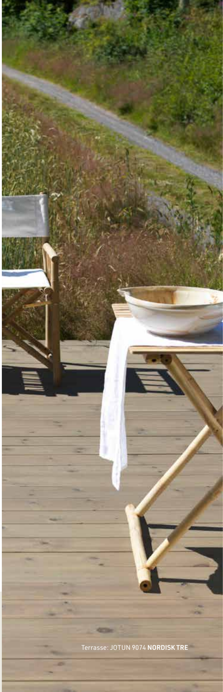
Terrasse: JOTUN 9074 NORDISK TRE