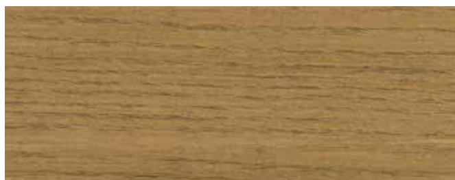
JOTUN 0678 FURU