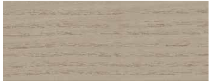
JOTUN 9073 SHIMMERGRÅ