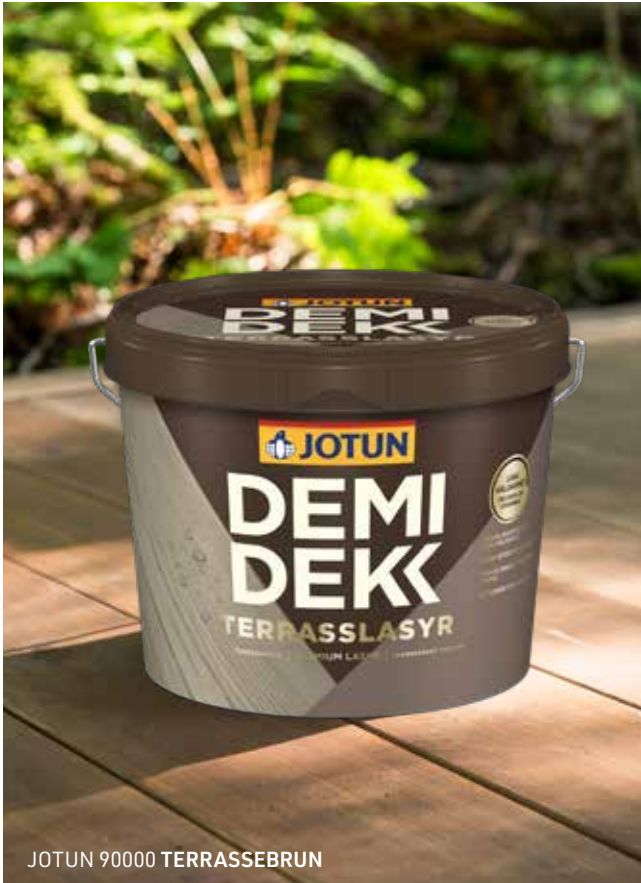
JOTUN 90000 TERRASSEBRUN

Alle Farbtöne von DEMIDEKK TERRASSLASYR wurden entwickelt, um das Holz zu schützen und ansprechend aussehen zu lassen. In dieser Farbkarte finden Sie die am häufigsten gewählten Farben. Weitere Farben können Sie in unseren Verkaufsstellen ansehen.