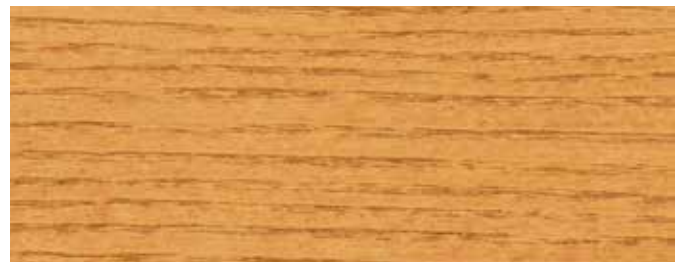
JOTUN 10077 KIEFER