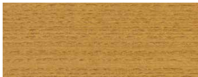
JOTUN 10083 EICHE ANTIK