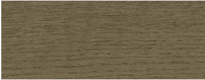
JOTUN 0637 NYSTENGRÅ