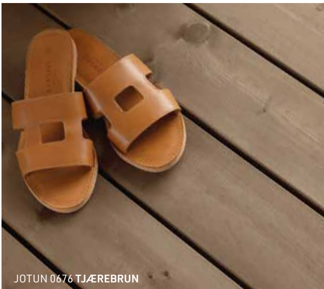
JOTUN 0676 TJÆREBRUN