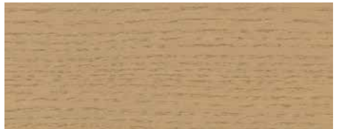
JOTUN 9050 STRÅ