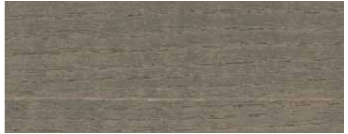
JOTUN 9710 TERRASSEGRÅ