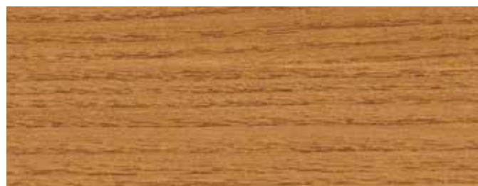
JOTUN 0909 KASTANIE