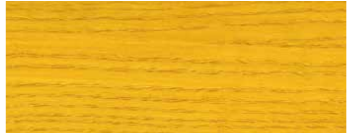
JOTUN 0601 GELB