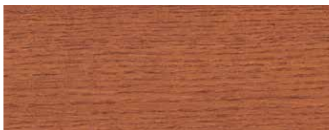
JOTUN 9124 RØDHETTE