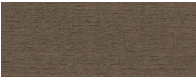
JOTUN 90002 GRÅSVART