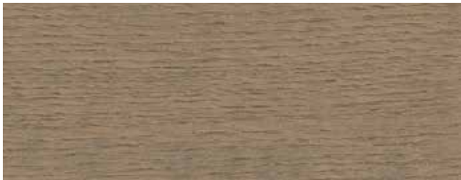
JOTUN 90001 FJELLBRIS