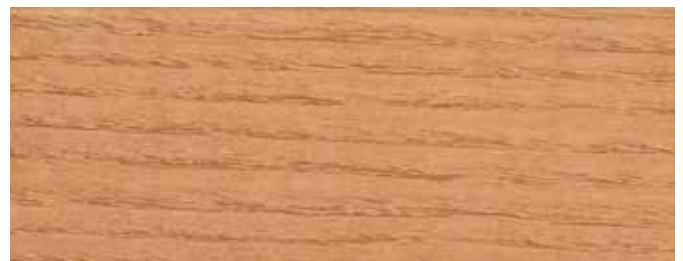
JOTUN 0935 SIBIRISCHE LÄRCHE