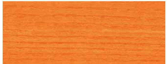
JOTUN 0932 ORANGE