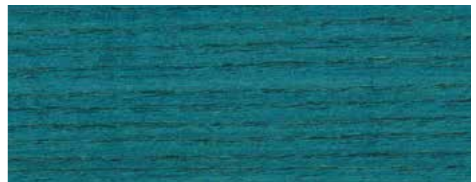
JOTUN 0955 SIGNALBLAU